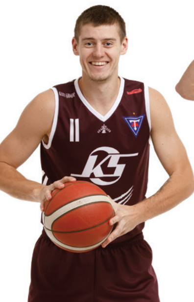
11 DAVIS GEKS